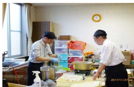
■11/27 グルメ会(出張そば)