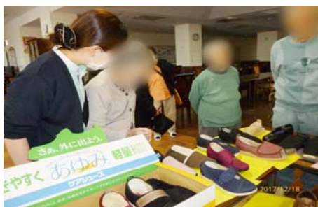
■12/18 介護シューズ販売